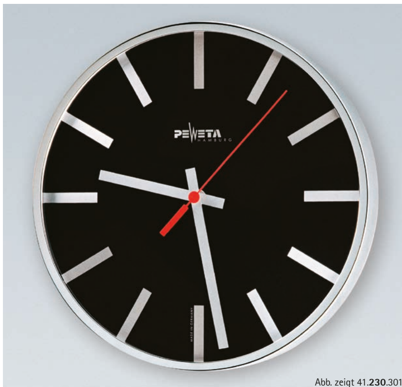
Abb. zeigt 41.230.301

Funkuhren DCF77 und Nebenuhren AirPort24 mit Netzbetrieb 230 V dieser Typreihe werden mit integrierter Gangreserve geliefert, Weiterbetrieb bei Stromausfall ca. 14 Tage.