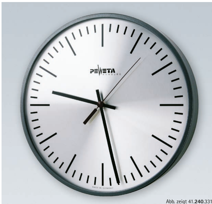
Abb. zeigt 41.240.331