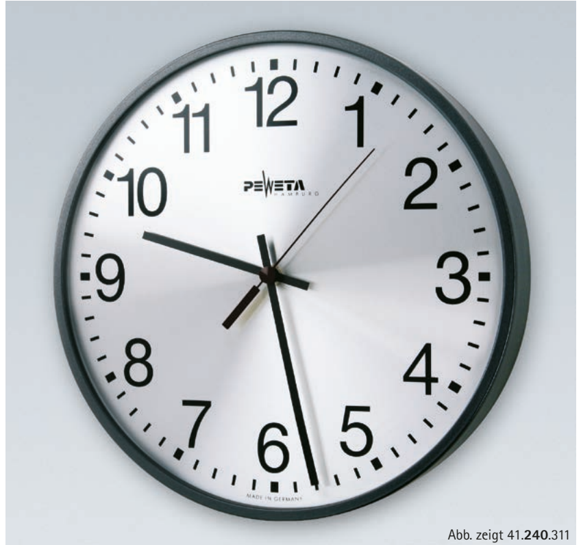
Abb. zeigt 41.240.311

Zum Betrieb von NTP-Nebenuhren ist ein NTP-Zeitserver erforderlich (s. Seite 191).