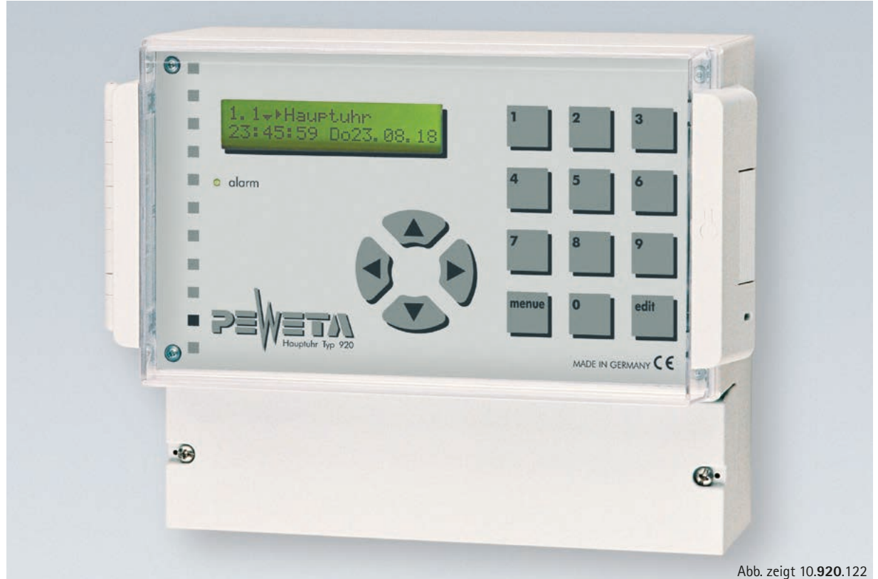
Abb. zeigt 10.920.122