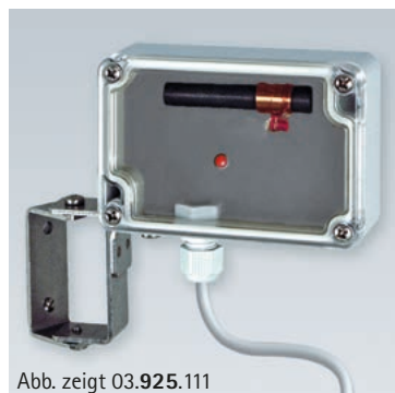
Abb. zeigt 03.925.111

Das DCF77-Zeitzeichentelegramm, gesendet auf der Frequenz 77,5 kHz vom deutschen Zeitzeichensender Mainflingen bei Frankfurt, ist ein übergeordnetes Zeitnormal zur Synchronisation sowie zur automatischen Sommer-/Winterzeitumstellung von Funkuhren und Zeitdienstanlagen. Dieser PEWETA DCF77-Funkempfänger liefert die Zeit- und Datuminformationen an alle PEWETA-Hauptuhren.