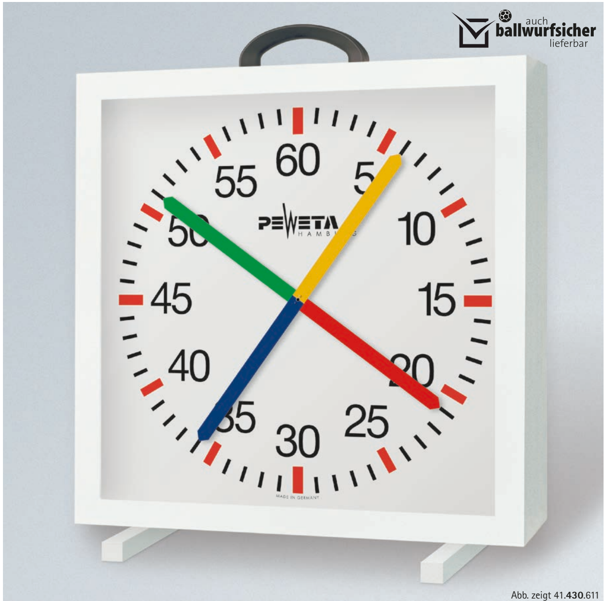
Abb. zeigt 41.430.611

Diese Trainingsuhr ermöglicht die Anzeige von Zwischenzeiten im Schwimmtraining und beim Einschwimmen. Die Zeiten nimmt jeder Schwimmer selbst. Das 4-farbige Zeigerkreuz zeigt die abgelaufene Zeit, eine Umdrehung entspricht 60 Sekunden.